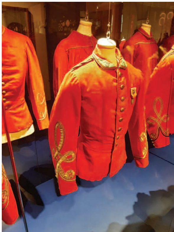
De 'roodhemden' van de officieren, inclusief onderscheidingen. Foto gemaakt in het Risorgimento museum in Brescia